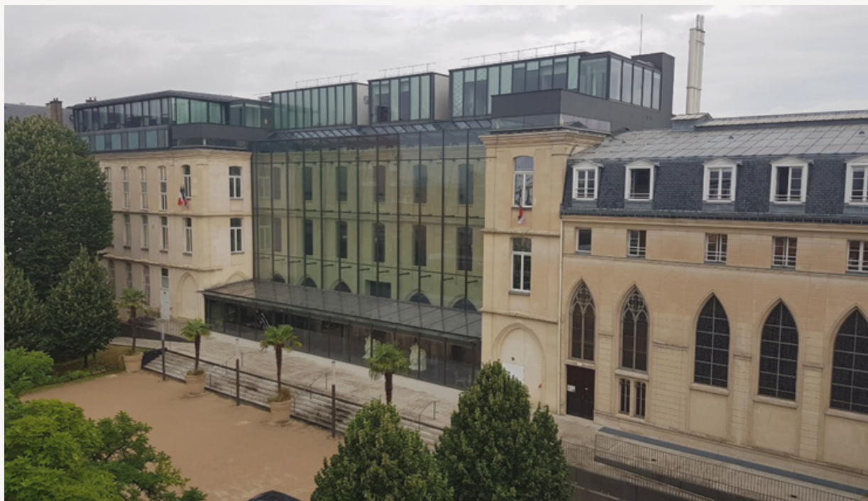
Ci-dessus, le site de la Médiathèque à Charenton Ci-dessous, le site du fort de Saint-Cyr

Service d'archives qui ne dit pas son nom, conservant les archives de la restauration de Notre-Dame de Paris depuis Viollet-le-Duc en même temps que les photographies de Brigitte Bardot, la Médiathèque du patrimoine et de la photographie (MPP) peut facilement être qualifiée d'OPNI : « objet patrimonial non identifié ».