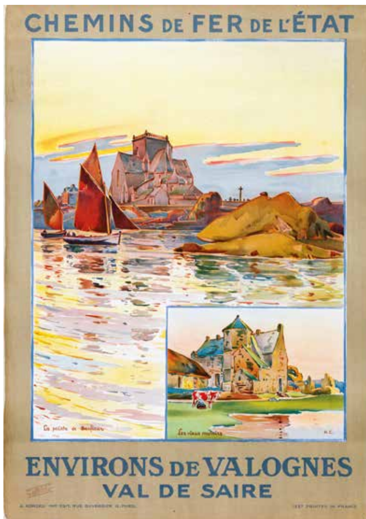
Fig. 3 – Affiche touristique du Val-de-Saire, début du XX e siècle.

36. La maison d'Harcourt est une des familles les plus anciennes et les plus illustres de France et d'Angleterre. Fixée d'abord dans l'Eure au X e siècle, et très prolifique, elle s'installe pour la première fois en Cotentin (à Saint-Sauveur-le-Vicomte) par mariage au début du XIII e siècle. Les marquisats de La Motte et de Thury (Calvados) furent érigés en duché (1700) pairie (1709) pour la branche cadette de Beuvron, qui compta plusieurs maréchaux de France et de nombreux officiers généraux. Anne-Pierre (1701-1783), 4 e duc d'Harcourt, devint gouverneur de Normandie en 1750, charge qui fut transmise en 1776 à son fils