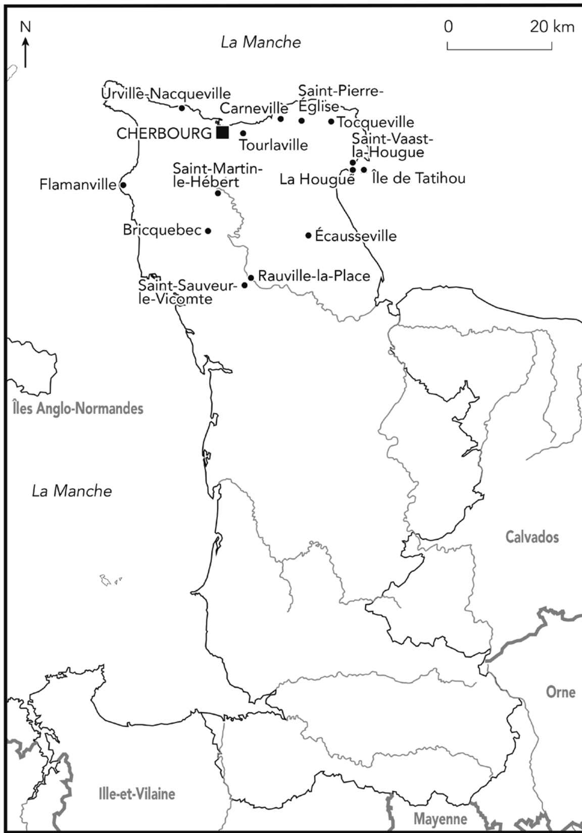
Département de la Manche, carte des sites publiés (P. Brunello).